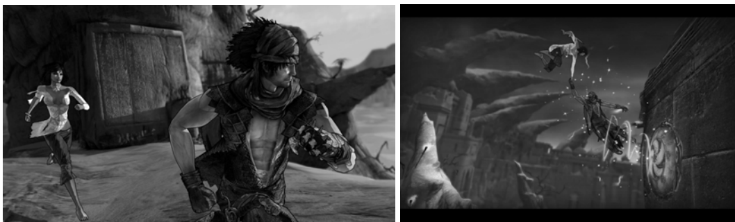
Abb 1.: Der Prinz und Elika, Prince of Persia

Sie ist sein letzter Speicherstand und eine Erweiterung seiner Fähigkeiten. Elika hilft ihm über Abgründe, indem sie mit ihm springt und ihn weiterschleudert, sie setzt magische Attacken ein, um Gegner zu verwirren. 21